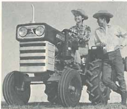
三菱トラクター R1500ハイパワー15馬力