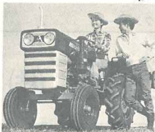
三菱トラクター R1500ハイパワー15馬力